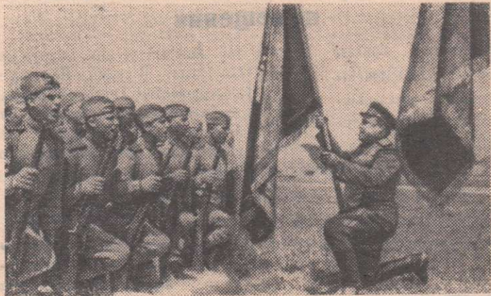
На снимке: воины у боевого знамени дают клятву биться с врагом до полной победы.

25 лет отделяют нас от 22 июня 1941 года, когда на вероломное нападение фашистской Германии советский народ ответил Великой Отечественной войной. Путь к победе был чрезвычайно трудным. Под руководством Коммунистической партии советские люди сумели мобилизовать свои силы для отпора захватчикам, проявили чудеса героизма, мужества, отваги в борьбе с врагом. Уже в декабре 1941 года Советская Армия перешла в контрнаступление под Москвой и разгромила большую группировку гитлеровских войск. Это было первое крупное поражение немецко-фашистской армии. Битва под Сталинградом положила начало коренному перелому в ходе всей второй мировой войны. Летом 1943 года Советская Армия разгромила отборные силы противника на Курской дуге и окончательно вырвала из рук врага стратегическую инициативу. В последующих сражениях и в завершающей битве за Берлин советские войска наголову разгромили фашистские полчища и принудили гитлеровскую Германию к безоговорочной капитуляции. Это была победа всемирно исторического значения. Наш народ отстоял свободу и независимость своей Родины, защитил великие завоевания социализма, спас человечество от угрозы фашистского порабощения. Победа Советского Союза явилась свидетельством несокрушимости и великих преимуществ советского социалистического строя. Она стала поворотным пунктом в судьбах мира, коренным об-